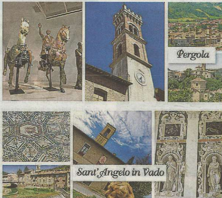
QUATTRO PERLE La pubblicazione è dedicata a Fossombrone, Mondavio, Pergola e Sant'Angelo in Vado

UN «ITINERARIO» per scoprire la bellezza dei nostri luoghi e le enormi opportunità offerte ad un visitatore od un turista che, probabilmente, nemmeno si immagina quanti tesori questo territorio custodisce. Confcommercio Pesaro e Urbino ha attivato un progetto il cui percorso è iniziato con la gestione degli uffici turistici e dei servizi museali delle città di Mondavio, Fossombrone, Pergola e Sant'Angelo in Vado ma che contempla anche una intensa attività turistica in Italia e all'estero; una costante attività di comunicazione attraverso i vari media e social; la commercializzazione di pacchetti e offerte da parte del tour operator Riviera Incoming; l'organizzazione di eventi, convegni,