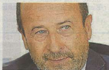
CRITICO Amerigo Varotti

DIVERSI sindaci della nostra Provincia con la 'divisa' da consiglieri provinciali, nelle settimane scorse hanno a più riprese approvato la variante al Piano urbanistico provinciale per consentire la realizzazione di un Outlet nel Comune di Mondolfo. Contemporaneamente in diversi Comuni si stanno ipotizzando nuovi supermercati o centri commerciali ed anche nella vicinissima Romagna si discute della possibile realizzazione di un outlet ai nostri confini. Da poco, prevista dalla variante al Prg del Comune di Fano contestata da Confcommercio e consentita dalla legislazione sul raddoppio automatico della superficie di vendita, è stato poi raddop-